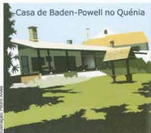
Ilustração: Pedro Alves

Após os bons resultados deste acampamento, B-P resolveu começar a escrever o livro “Escutismo para Rapazes”. Este livro foi inicialmente publicado em